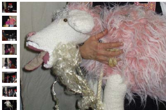
"Uff de schwäbsche Eisebohna" in pantomimischer Darstellung - mit Ziege!