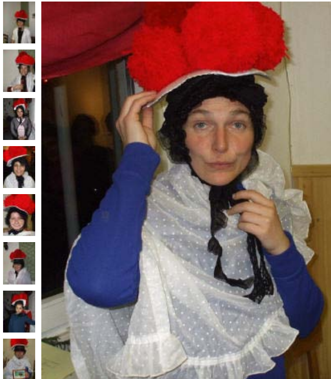
Viele viele Schwarzwald-Mädle und auch zwei -Jungs!