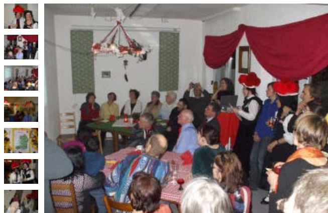
Volles Haus mit Schwaben und Nicht-Schwaben. Doch nicht jedem steht ein Bollenhut!