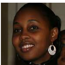
aCAMPada Berlin auf dem